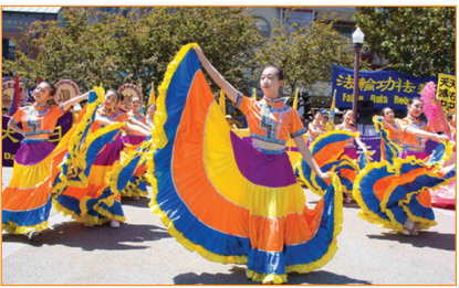
Các học viên Pháp Luân Công tổ chức các hoạt động chào mừng ngày Pháp Luân Đại pháp thế giới trước Tòa thị chính thành phố San Francisco, Mỹ.