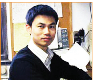
Ngô Vi Tiêu, 26 tuổi đỗ tiến sỹ, 29 tuổi giành giải thưởng Nhà khoa học trẻ tuổi nước Mỹ, năm 2009 (34 tuổi) đạt Giải thưởng Kinh tế học Koopmans.