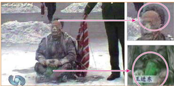
Tóc và chai nhựa dựng đứng xăng vì sao bị đốt mà không cháy nổ?