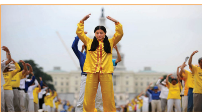
Nhật báo Phố Wall chọn đăng bức hình: Các học viên Pháp Luân Công luyện công tại Washington DC. Toàn thế giới có 100 triệu người tu luyện Pháp Luân Công, Pháp Luân Công thực sự mang lại lợi ích sức khỏe cho người dân.

Nhờ sự hồng truyền của Pháp Luân Công, rất nhiều người đã thu được lợi ích cả về thể chất lẫn tinh thần, Pháp Luân Công cũng nhận được nhiều lời khen ngợi vì những lợi ích mà môn tập mang lại cho xã hội. Ngày 31/08/1993, Bộ Công an Trung Quốc cảm ơn Đại sứ Lý Hồng Chí vì hiệu quả chữa bệnh thần kỳ của Pháp Luân Công; năm 1998, các cuộc điều tra sức khỏe chuyên sâu về các học viên Pháp Luân Công đã đưa ra kết luận: "Pháp Luân Công đối với xã hội chỉ có trăm phần lợi mà không có một phần hại." Các báo cáo tích cực đã được gửi lên Đảng Cộng sản Trung Quốc.