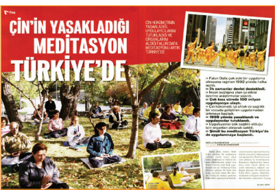
Tạp chí Thời đại mới của Thổ Nhĩ Kỳ nhận xét: Pháp Luân Công giúp cho rất nhiều người tu luyện có được thân thể khỏe mạnh, tinh thần thanh tịnh, đạo đức được nâng cao.